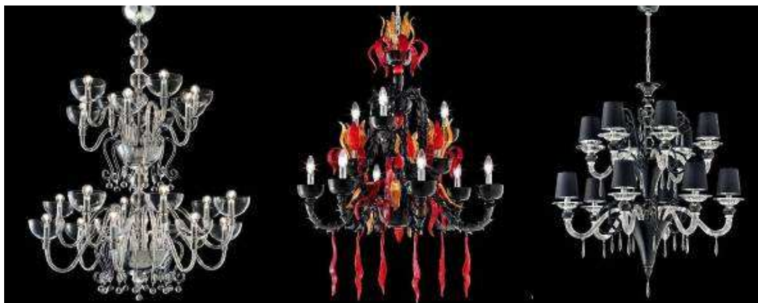
Nowoczesne żyrandole z Murano: art déco, fuzja i ekstrawagancja w absolutnie najwyższej jakości

Bardzo popularny jest trend łączenia tradycyjnego wzornictwa ze śmiałą, nowoczesną kolorystyką. Nowością jest zupełnie nieprzejrzyste szkło.