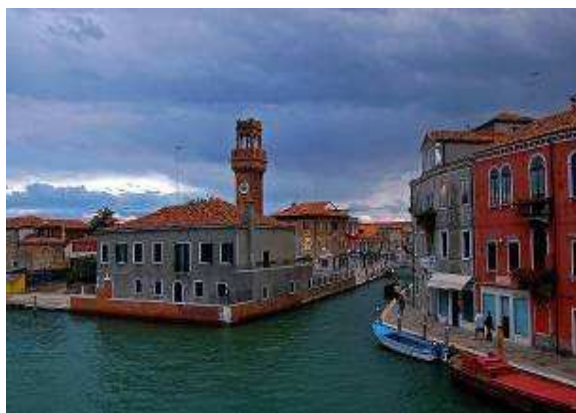
Tak jak Wenecja, Murano jest położone na skupisku wysepek

Murano to małe włoskie miasteczko położone w całości na małej grupie wysp, podobnych do – i położonych zaraz obok - Wenecji. Wodny autobus płynie z Murano do Wenecji jedynie 17 minut.