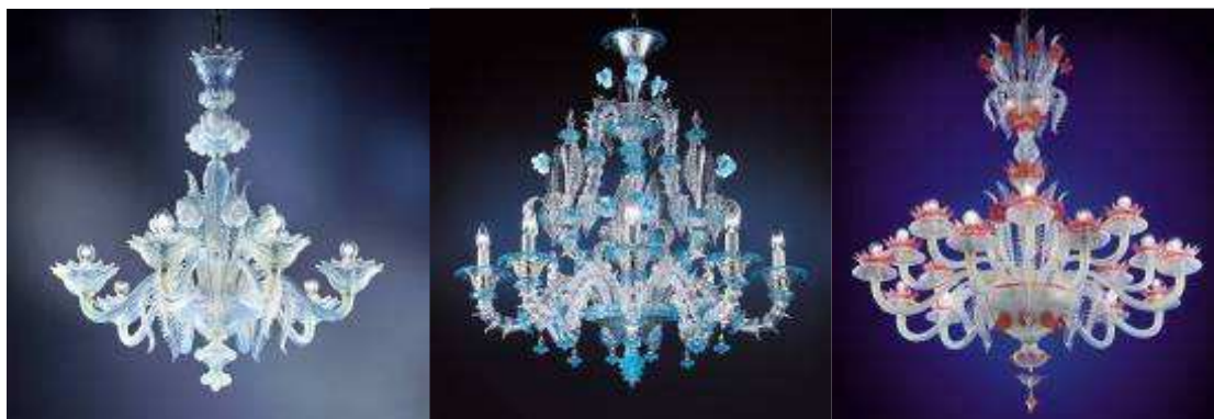
Weneckie wzory, które cieszyły się powodzeniem w XVIII wieku