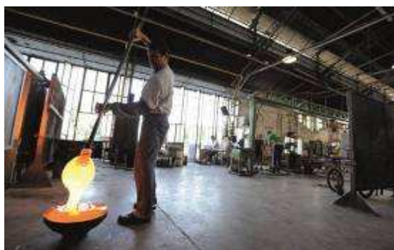
Płynne szkło pozwala się formować tylko przez chwilę

Proces jest skomplikowany i wymaga absolutnej dokładności. Szkło składa się z krzemionki z różnymi dodatkami. Rozgrzewa się je do czerwoności i pełnej płynności w specjalnych piecach. Podczas stygnięcia masy i jej stopniowego powrotu do stanu stałego mistrzowie dmuchacze mają kilka sekund na nadanie mu pożądanego kształtu.