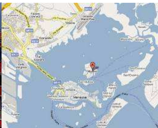
Murano na mapie Google