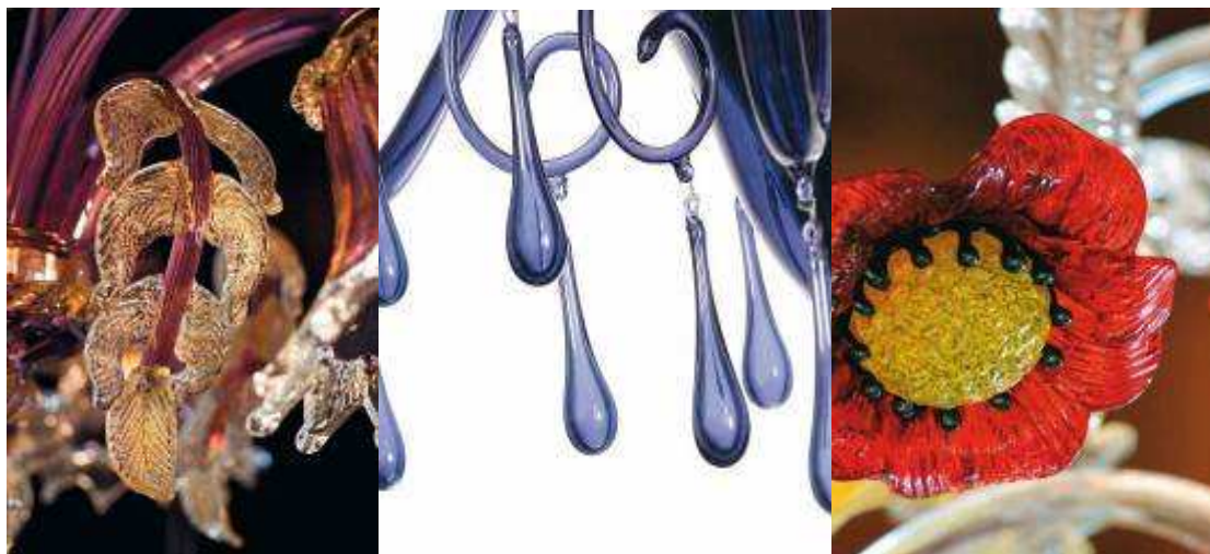
Zbliżenia żyrandoli z Murano ukazują wspaniałą przejrzystość szkła i spektakularny kunszt

Szklane wyroby z Murano słyną w świecie z wybornej jakości, bajecznych kolorów i niezrównanego wykonania. Te cechy można zaobserwować gołym okiem przy odrobinie treningu (o tym poniżej).