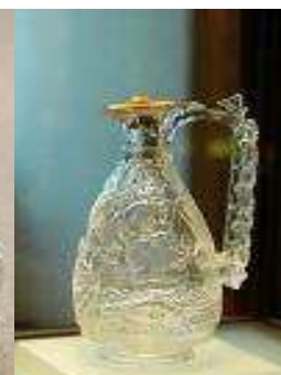
Karafka ze żłobionego kryształu górskiego

2. Istnieje też kryształ ołowiowy, który powstaje po dodaniu do szkła tlenku ołowiu (PbO). Ten dodatek powoduje wzrost współczynnika załamania światła, co oznacza, że szkło ołowiowe załamuje światło jak pryzmat. Im wyższy jest udział tlenku ołowiu w masie kryształu, tym żywsze kolory będzie on odbijać. Przepisy Unii Europejskiej określają, że aby móc sprzedawać towar jako kryształ ołowiowy, wymagany jest minimalny udział ołowiu na poziomie 24%. Amerykańskie normy natomiast, przeciwnie, jako kryształ określają każde szkło, które charakteryzuje się idealną przejrzystością, niezależnie od ilości dodanego ołowiu. Dla porównania, kryształ Swarovskiego zawiera 32% tlenku ołowiu.