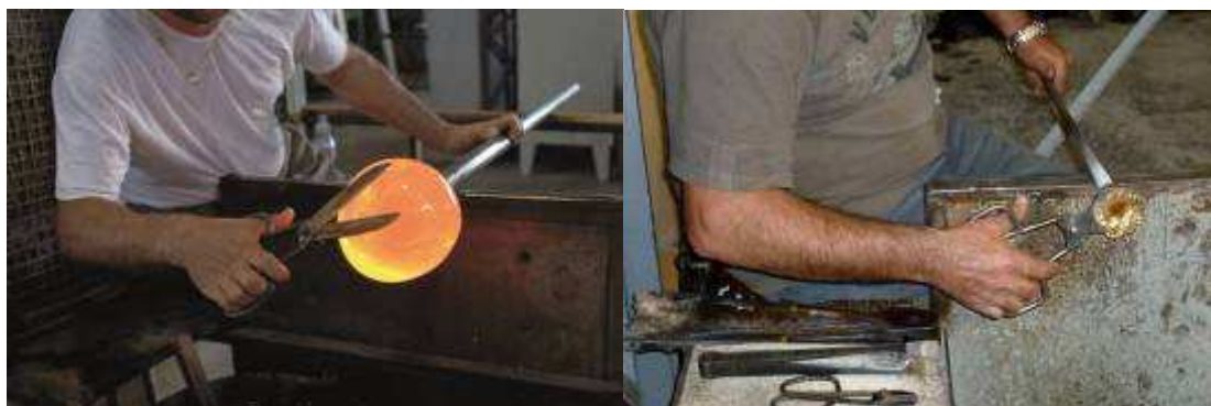
Wydmuchane, a następnie otwarte na jednym z końców żelaznymi nożycami

Mogą je przeprowadzić wdmuchując w szkło powietrze przez długą cienką rurę i/ lub nadając szkłu konkretny kształt ręcznie. Należy dodać, że „ręcznie” oznacza w tym przypadku użycie żelaznych narzędzi, jako że szkło jest wciąż rozżarzone!