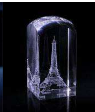
Trójwymiarowa pamiątka grawerowana laserem