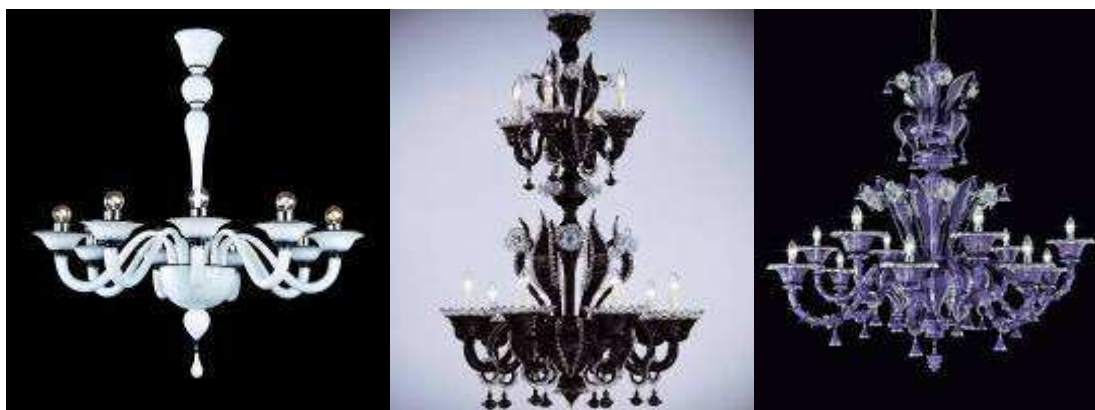
Nowoczesne kolory i nieprzejrzyste szkło sprawiają, że te tradycyjne piękności prezentują się modnie i nawet dość współcześnie

Bardzo popularny jest trend łączenia tradycyjnego wzornictwa ze śmiałą, nowoczesną kolorystyką. Nowością jest zupełnie nieprzejrzyste szkło.