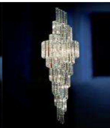
Kryształ optyczny i sztrasy - lampa