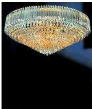
Ogromny żyrandol hotelowy

4. I, wreszcie, jest jeszcze kryształ optyczny , czyli najwyższej jakości, idealnie przejrzyste szkło, szlifowane przez nadzwyczaj precyzyjne nowoczesne maszyny, co poprawia jego współczynnik załamania światła. Tę metodę stosuje się w coraz większym stopniu w przypadku lamp o dużych rozmiarach, ponieważ szkło bez dodatku ołowiu jest znacznie lżejsze. Swarovski Spectra to linia produktów kryształowego giganta, która jest dobrym przykładem kryształu optycznego.