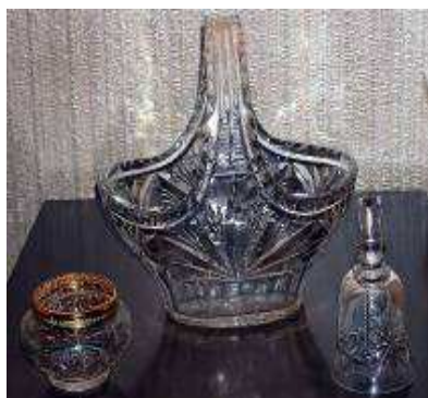
Tradycyjna zastawa stołowa