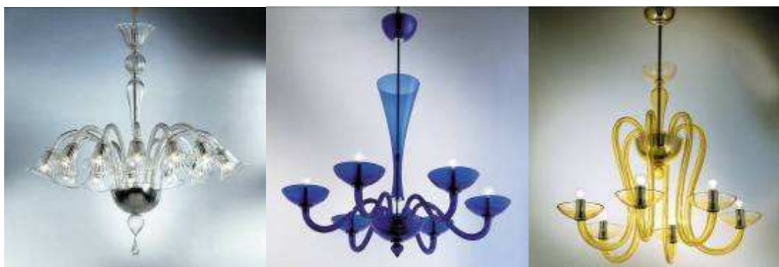
Weneckie wzory, które cieszyły się powodzeniem w XX wieku