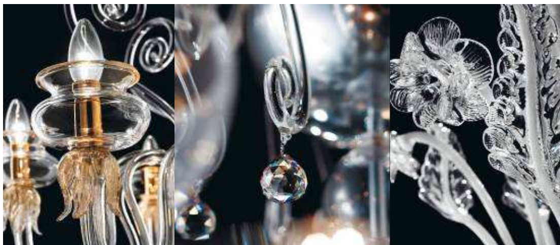
Krystalicznie przejrzyste, ale nie będące kryształem: niezrównana przejrzystość szkła z Murano