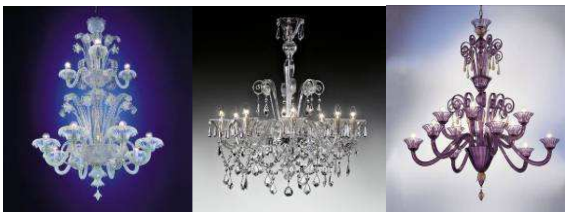
Weneckie wzory, które cieszyły się powodzeniem w XIX wieku