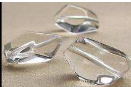
Paciorki z kryształu górskiego