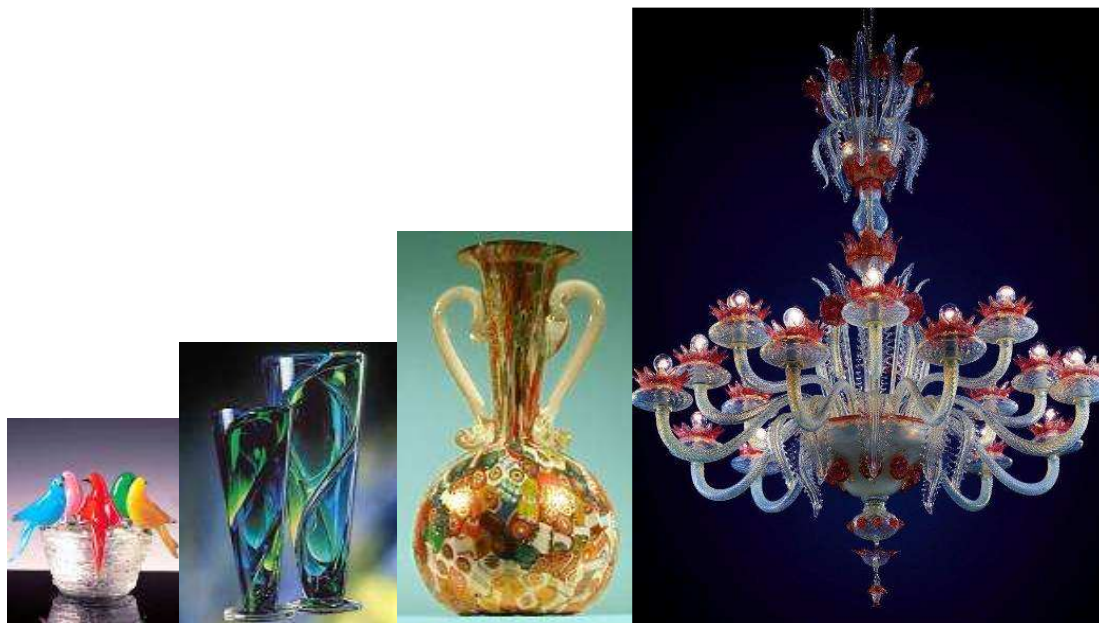
Murańskie rękodzieło ze szkła obejmuje między innymi: figurki, zastawę stołową, wazony i słynne żyrandole