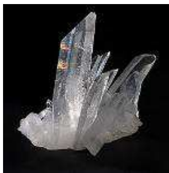
Naturalny kryształ górski (kwarc)

1. Pierwsze, pierwotne znaczenie odnosi się do kryształu górskiego (kwarc), który jest naturalnym minerałem krystalicznym, znajdującym się w skorupie ziemskiej. Niektóre jego odmiany są kamieniami półszlachetnymi i mogą być szlifowane tak, by imitowały diamenty. Swego czasu były one rozpowszechnione w Europie i na Środkowym Wschodzie w produkcji biżuterii. Na prezentowanych zdjęciach widać jedynie przezroczystą formę kwarcu, podczas gdy w naturze występują również inne kolory, wśród których najbardziej znany jest ametyst oraz różowy kwarc.