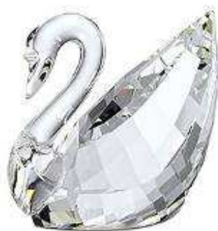
Figurka z kryształu Swarovskiego