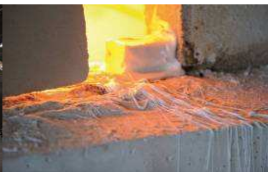
Pasma zastygłego szkła w pobliżu pieca